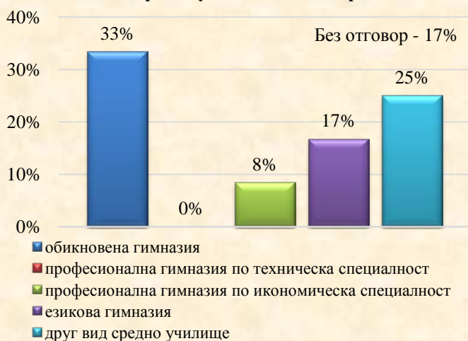
3. Какво средно училище сте завършили: