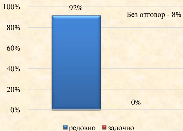
2. За каква форма на обучение кандидатствате: