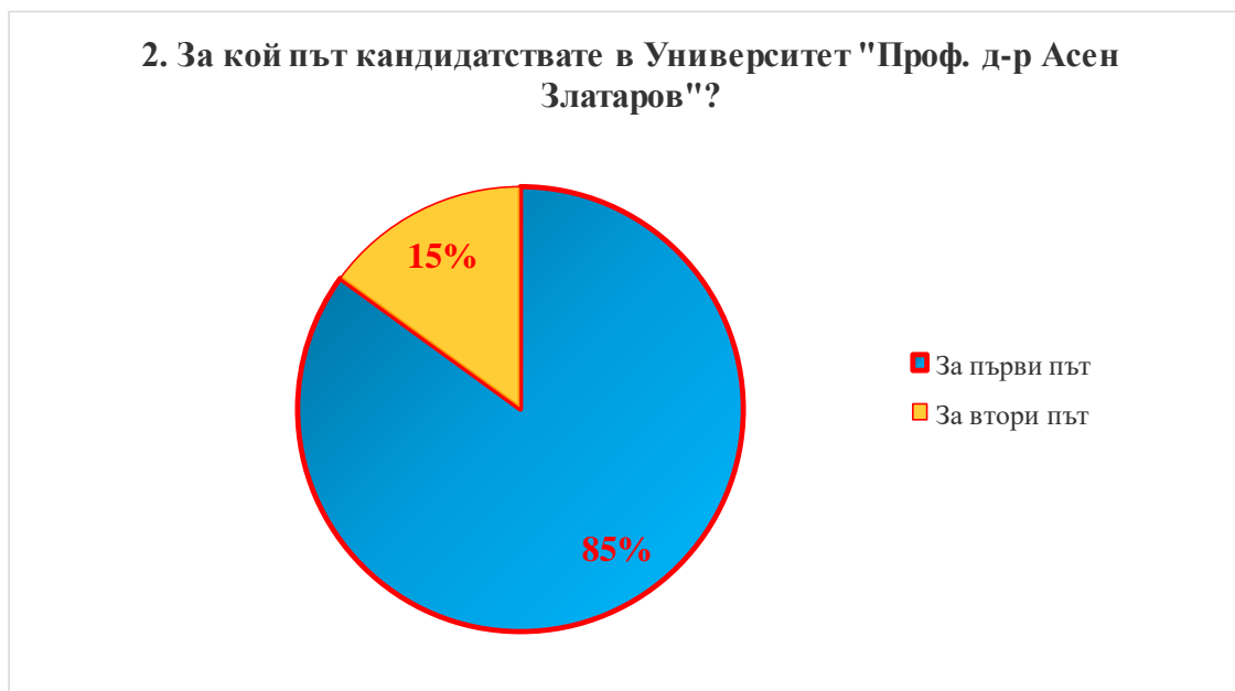
Фигура 2. Проучване мнението на студентите от специалност „Медицина“; втори въпрос от анкетата; отговорите са в проценти