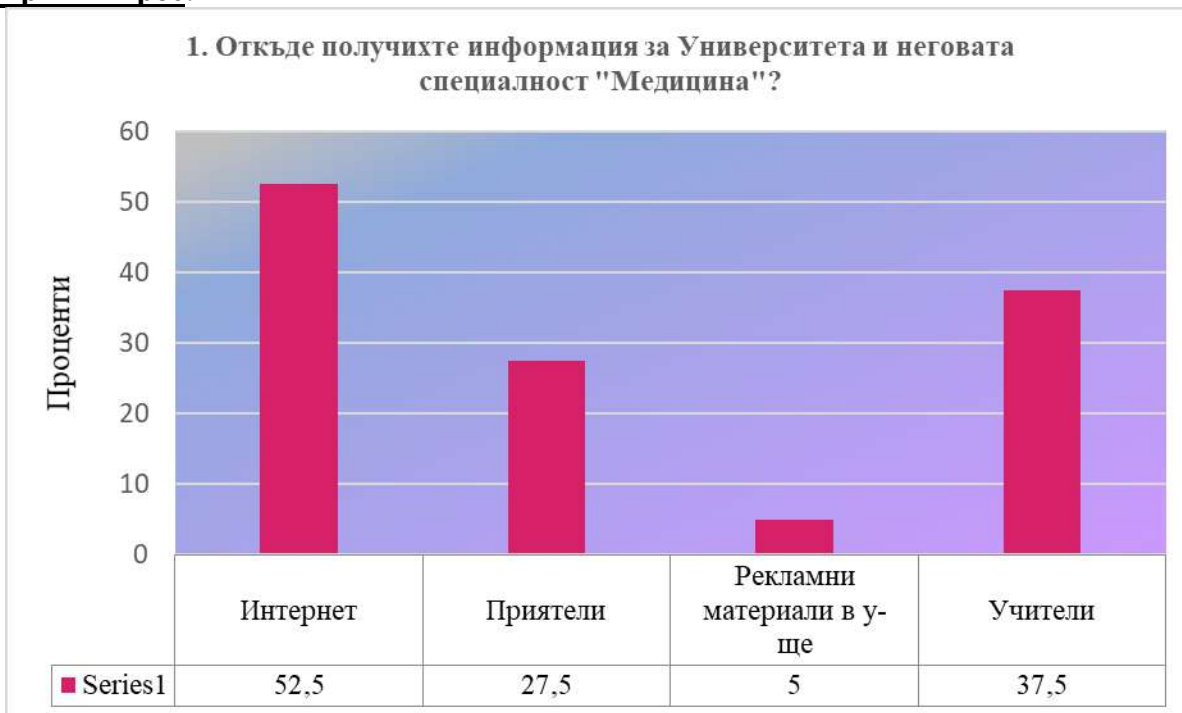
Фигура 1. Проучване мнението на студентите от специалност „Медицина“; първи въпрос от анкетата; отговорите са в проценти