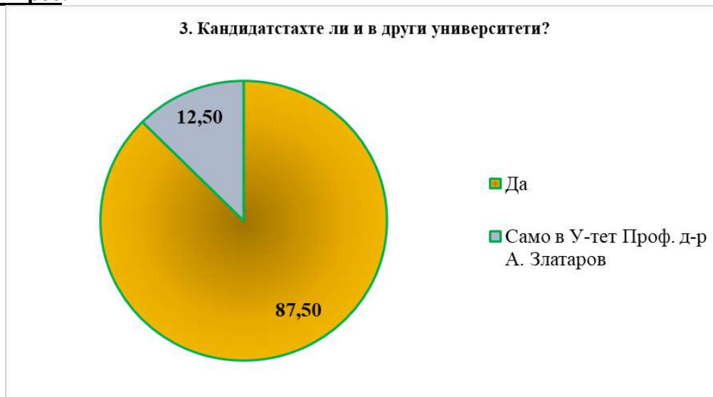
Фигура 3. Проучване мнението на студентите от специалност „Медицина”; трети въпрос от анкетата; отговорите са в проценти