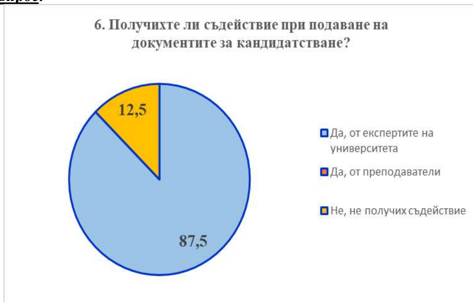
Фигура 6. Проучване мнението на студентите от специалност „Медицина“; шести въпрос от анкетата; отговорите са в проценти