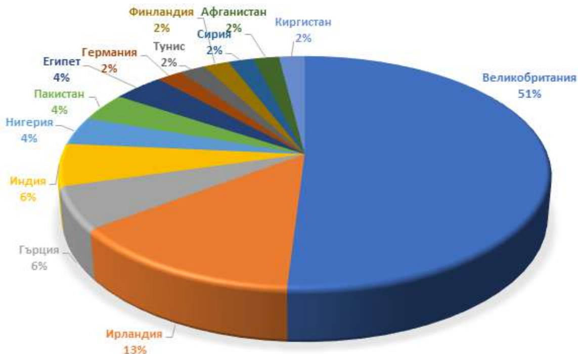
Фигура 2. Процентно съотношение на приети студенти по медицина, англоезично обучение за учебната 2023/2024 г. в Медицински факултет на Университет „Проф. д-р Асен Златаров“, Бургас по държави на живеене