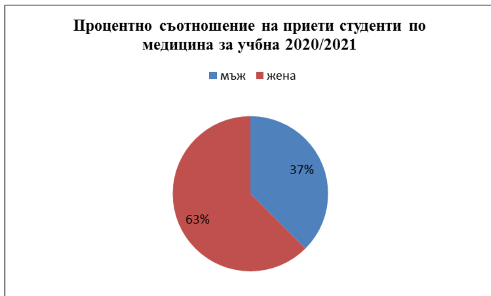
Фигура 1. Процентно съотношение на приети студенти по медицина за учебната 2020/2021 г. в Медицински факултет на Университет „Проф. д-р Асен Златаров“, Бургас

От приетите 40 студенти по специалност „Медицина“, 13 са получили средно образование в училища от Бургас, 4 от София, 3 от Велико Търново и по един от Пазарджик, Люляково, Търговище, Сливен, Русе, Добрич, Свиленград, Тетевен, Силистра, Българово, Бяла Слатина, Карагеоргиево, Дулово, Бистрица, Хасково, Момчилград, Айдемир, Царево, Гоце Делчев (фигура 2).