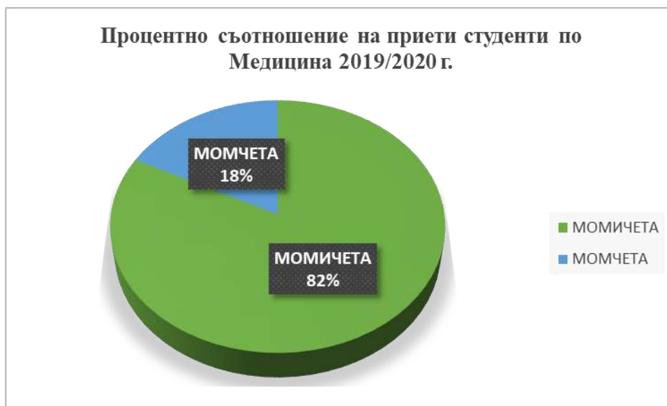
Фигура 1. Процентно съотношение на приети студенти по медицина за учебната 2019/2020 г. в Медицински факултет на Университет „Проф. д-р Асен Златаров“, Бургас

От приетите 40 студенти по специалност „Медицина“, 10 са получили средно образование в училища от Бургас, 3 от София, 3 от Варна, 3 от Търговище, 2 от Сливен, 2 от Русе, 2 от Добрич, 2 от Ботевград и по един от Руен, Сандански, Свиленград, Пазарджик, Пещера, Плевен, Айтос, Самоков, Стара Загора, Монтана, Панагюрище, Велико Търново, Димитровград (фигура 2).